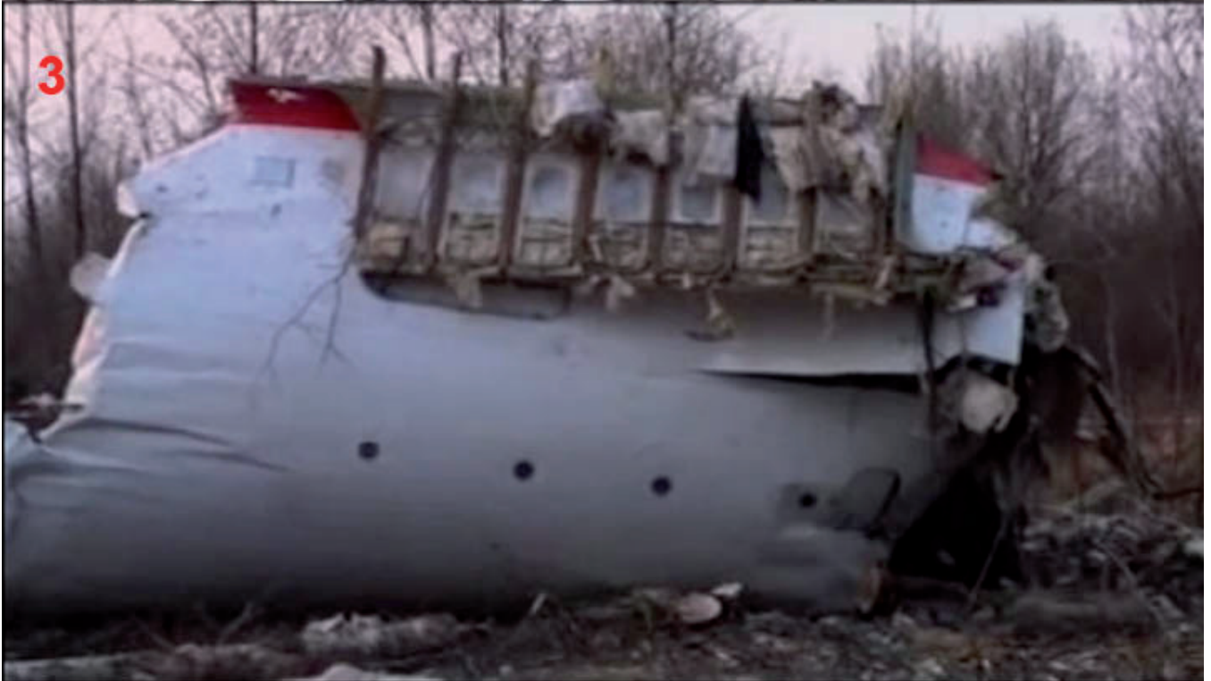
Poniżej zestaw z filmu „Mgła.”